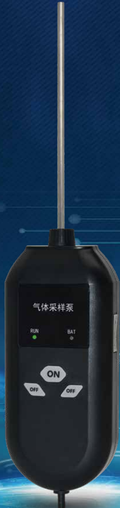
ABH505B 便携式气体采样泵